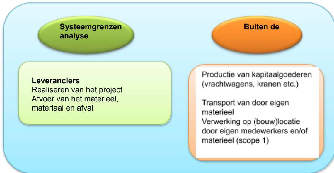
Figuur 2: Inkadering van de systeemgrenzen

Emissies die meegenomen worden in de ketenanalyse zijn weergegeven in onderstaande figuur. De belangrijkste emissiebronnen zijn